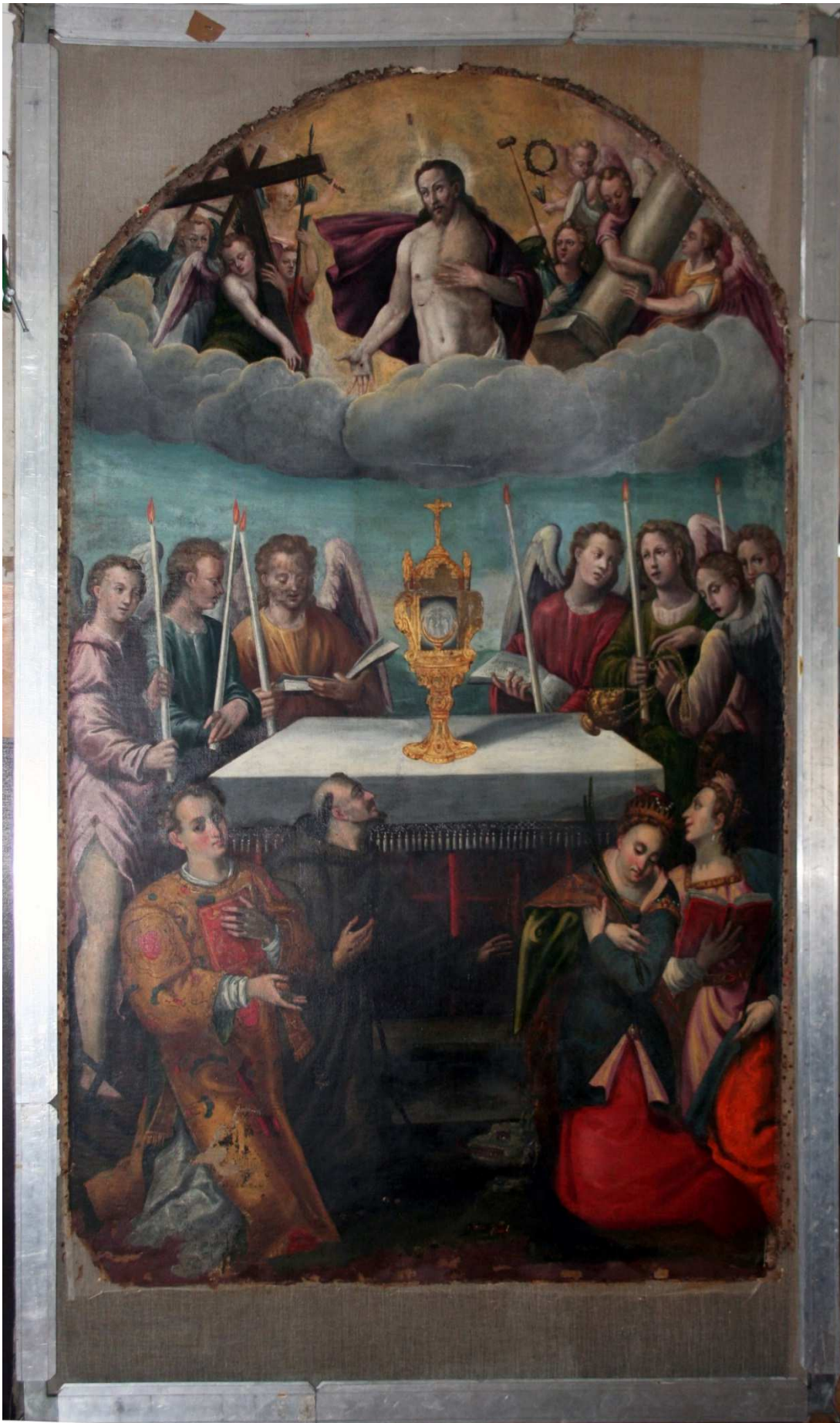
La pala dell'Adorazione